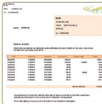
Le modèle de lettre de relance prêt à l'emploi ou personnalisable aux couleurs de votre entreprise.

Le suivi des échéances clients permet d'éditer très simplement des lettres de relance aux clients en retard de paiement par rapport à une date d'échéance.